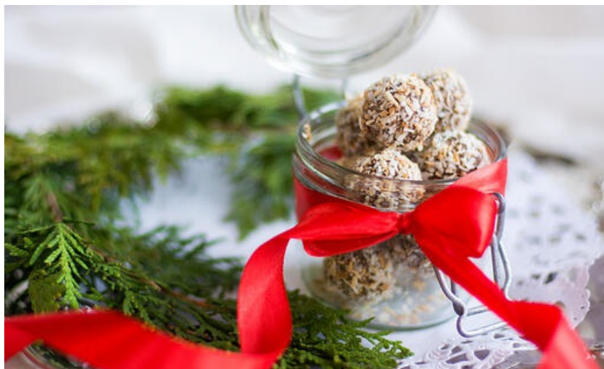
Amarulategyfflar med rostad kokos.