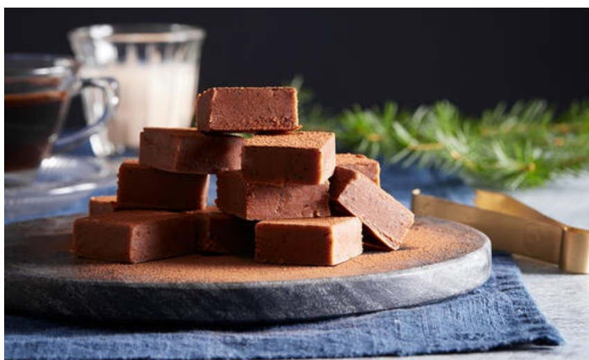
Fudge med mjölkchoklad, Amarula och kaffe.